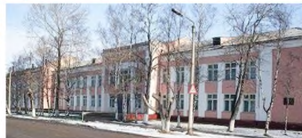
Здание, в котором размещался лечебный корпус эвакуационного госпиталя № 1943 (ныне Бабушкинский дом детского творчества) и Межобластной туберкулезный госпиталь инвалидов войны