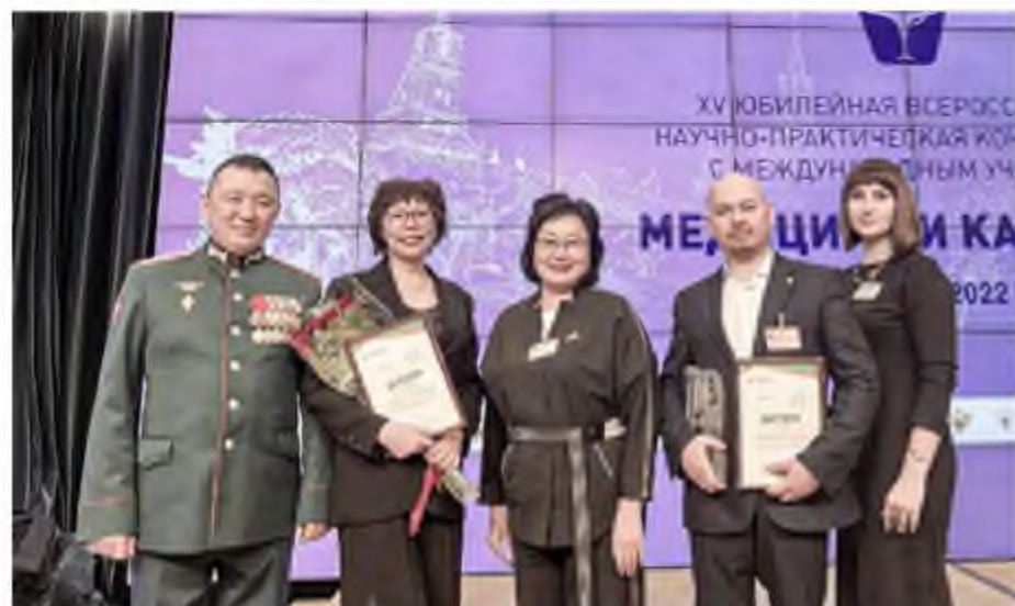
Во время награждения на конкурсе «Лучший врач России-2022»