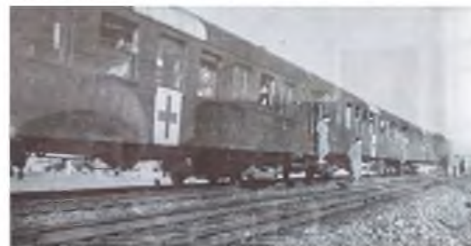
Прибытие эшелона с ранеными

Именно сюда привозили сотни раненых с фронта, с запада в больших вагонах. На станции их встречали на перроне санитарки, добровольцы, местные жители, которые помогали грузить тяжелораненых на повозки, запряженные лошадьми. После их перевозили в здание школы, в котором с 1903 года учились дети, но в годы войны его переоборудовали под госпиталь.