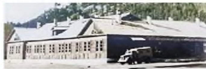
В 1954 году построено здание Заиграевской больницы

Есть очень интересное и историческое описание о строительстве Ацагатской медицинской школы и лечебницы в 1911–1930-х годах. В эти годы Ацагатский дацан стал крупным центром тибетской медицины. Для медицинской школы был построен Мамба-дуган — небольшое деревянное здание, крытое железной кровлей. В первое время в школе было около 50 учеников. В 1920–1930-х годах были построены лазарет, здание медицинской школы, хозяйственные постройки: амбары, завозни, бани. Здания лечебницы оснастили телефонной связью. В организацию медицинской школы большой вклад