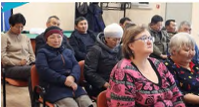
Жители села Гонда